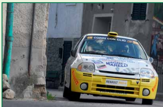
Valdiserri – Bernardi