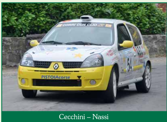
Cecchini – Nassi