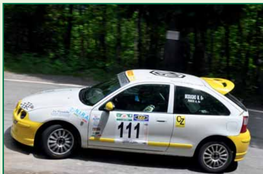
Modugno – Fuoco