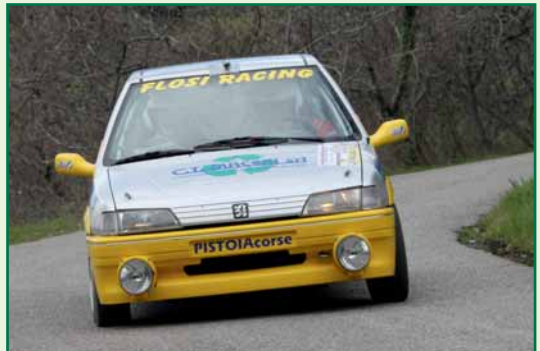
Flosi – Parrillo