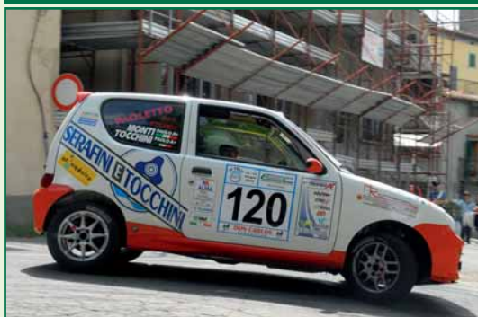
Tocchini – Monti