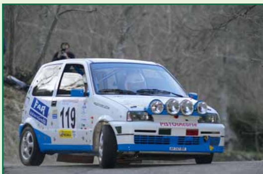
Chelucci – Zara