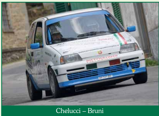
Chelucci – Bruni