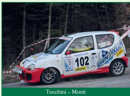
Tocchini – Monti