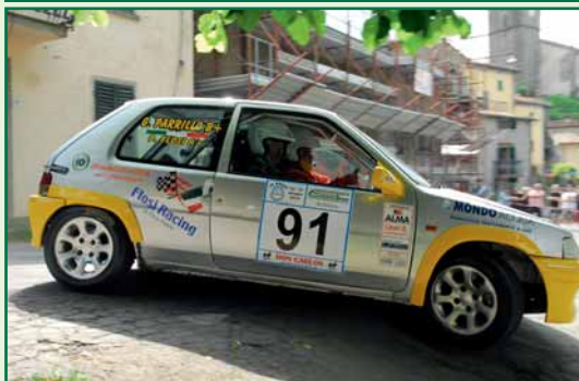
Flosi – Parrillo