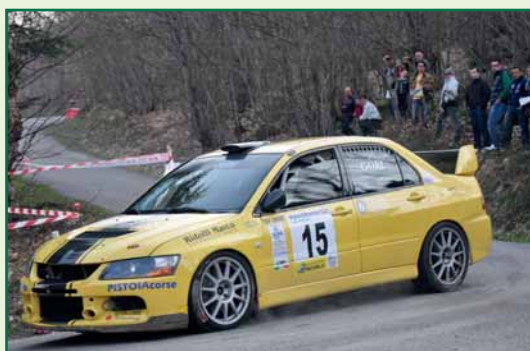
Gori – Pacini