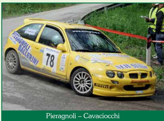
Pieragnoli – Cavacocchi